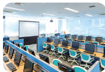
メディアセンター